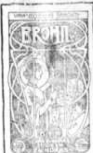
RECORDA O SEU TOSTE

Atenção: Só vendemos a dinheiro á vista e muito barato!